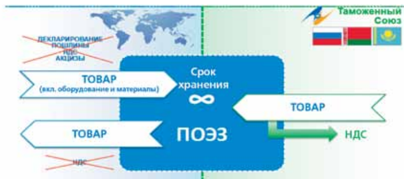
Преимущества процедуры «Свободная таможенная зона»

Отличие ОЭЗ Ульяновской области в том, что она портовая, зоны этого типа предназначены для развития транспортной инфраструктуры.