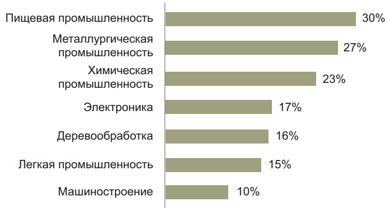
Рисунок 3. Доля логистических затрат в себестоимости готовой продукции по отраслям в России 2014 г., % [24]

Эксперты отмечают, что высокий уровень логистических затрат в России связан прежде всего с неэффективностью организации внутренней логистики компаний и транспортно-логистической системы страны в целом, помноженной на огромные