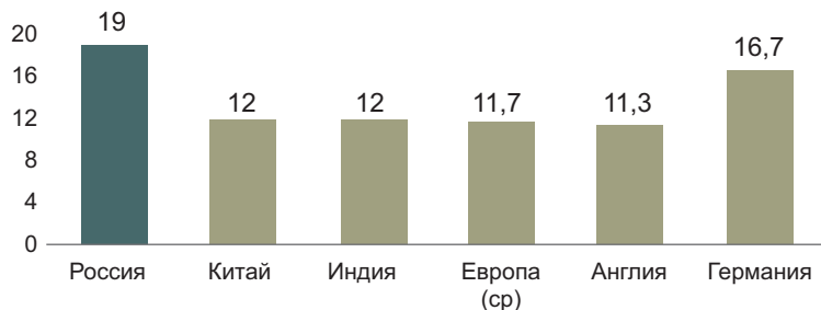
Рисунок 2. Доля логистических издержек в ВВП страны [29]

их точно не представляется возможным, так как большая часть логистических операций компании выполняют самостоятельно (64–68%), часть – заказывают сторонним логистическим и транспортным компаниям, а часть вообще не учитывают как транспортные издержки. Несовершенство учетных систем, их отсутствие у предпринимателей и невысокий уровень российской статистики еще больше ограничивают возможность точных расчетов.