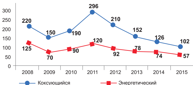
Рисунок 7. Динамика цен на уголь [20]

Это был вынужденный шаг. Без создания собственных операторов вагонов компании неизбежно столкнулись бы с проблемами в доставке собственных грузов на экспорт [3]. РЖД тогда была монополистом на российском рынке оперирования грузовыми вагонами: ее доля по объемам грузооборота в 2003 составляла 78,2% (к 2015 г. она снизилась до 14,3% [11]). Еврохим до сих пор владеет 7000 вагонами.