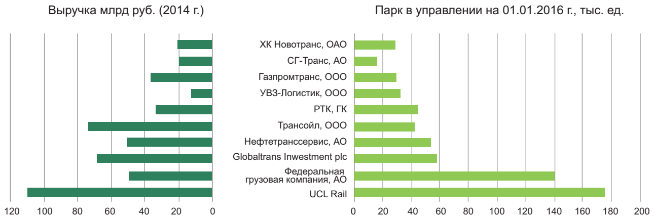
Рисунок 6. 10 крупнейших операторов вагонов. Светло-зеленым цветом выделены операторы, до сих пор входящие в одну группу с производителями сырья. Остальные – независимые аутсорсинговые логистические компании. Составлено по Спарк-Интерфакс, данным агентства Infoline

с 2000 г. осуществляет собственная трубопроводная система с наливным терминалом Лукойла (последний построен в 2008 г.).