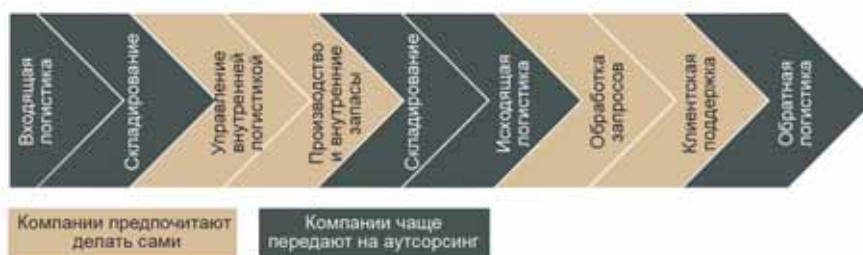
Рисунок 5. Виды операций, чаще всего передаваемых на аутсорсинг в России [6]

составляет значительную часть себестоимости продукции.