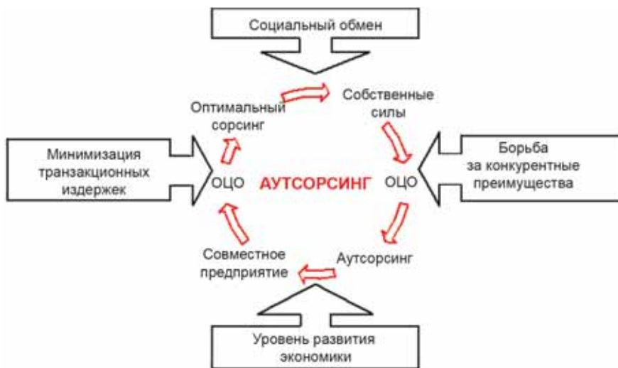
Рисунок 1. Ключевые теории, объясняющие аутсорсинг (сост. автором)