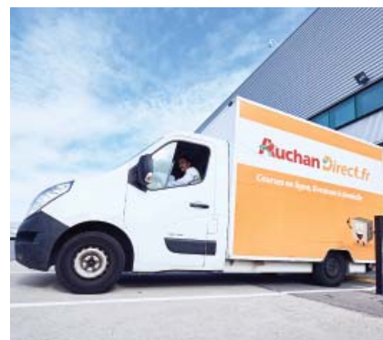
▲ Готовые заказы в соответствии с рейсом загружаются в грузовики и доставляются клиентам прямо на дом

межуточного хранения. Для ассортимента сухих продуктов предназначена отдельная шаттловая система, которая используется в качестве буфера перед отправкой.