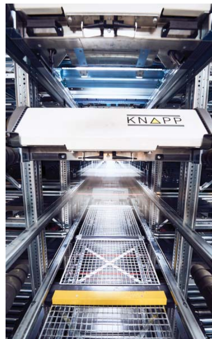
▲ Сердцем склада является система складирования и комплектования OSR Shuttle™, которая дополнительно служит буфером перед отправкой готовых заказов

Комплектование овощей и фруктов выполняется из полочных стеллажей напрямую в транспортные контейнеры. Для этого они разгружаются из OSR Shuttle и транспортируются в зону комплектования. После укомплектования соответствующего транспортного контейнера артикулами он направляется в OSR Shuttle для про-