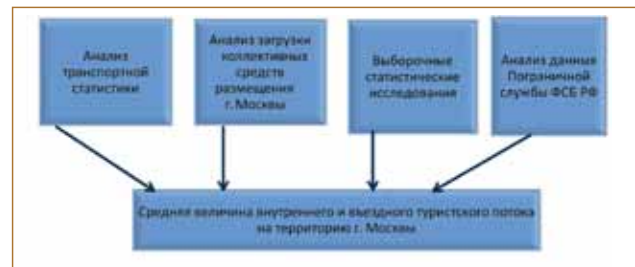
Рисунок 1 Структура проведения ежегодного мониторинга туристских потоков на территории г. Москвы

Структура ежегодного мониторинга туристских потоков в г. Москве представлена на рис. 1.