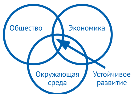
Рисунок 1. Составляющие устойчивого развития

Обеспеченность личными автомобилями, с одной стороны, является признаком экономической стабильности и финансовой состоятельности жителей страны. С другой – приводит к таким проблемам, как заторы, дорожно-транспортные происшествия, нехватка мест для парковки. К тому же сотни тысяч движущихся по городу автомобилей неблагоприятно влияют на экологическую обстановку города.