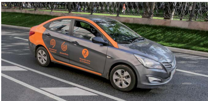
Таблица 3. Достоинства и недостатки каршеринга