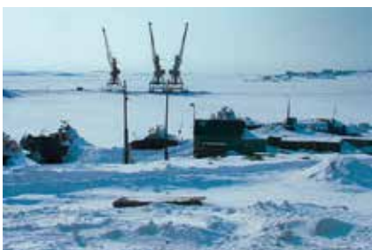
Поселок Диксон, май 2008 г.

В начале XXI в. возрос интерес к СМП со стороны компаний, перевозящих грузы. До настоящего времени основной транспортной магистралью, по которой перевозились грузы из Европы на Дальний Восток (в Японию, Китай и другие страны – импортеры европейских товаров), считался маршрут, идущий через Суэцкий канал. За год через него проходило примерно 18 тыс. судов (для сравнения, количество судов, идущих арктическим путем, исчислялось десятками). Однако в последние годы ситуация вокруг СМП стала меняться. К примеру, глобальное потепление стало одним из факторов, повлиявших на привлечение внимания к СМП. За последние 35 лет площади льда в Арктике уменьшились почти в два раза – с 7,1 до 3,45 км 2 . Вследствие таяния льдов значительно увеличился срок безледокольной навигации в северных морях. Если ранее навигация длилась с июля по сентябрь, то сегодня ее срок увеличился почти на три месяца – с июня по ноябрь, при этом в сентябре и октябре лед практически отсутствует на всем протяжении трассы.