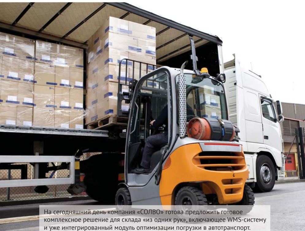
На сегодняшний день компания «СОЛВО» готова предложить готовое комплексное решение для склада «из одних рук», включающее WMS-систему и уже интегрированный модуль оптимизации погрузки в автотранспорт.

Рассчитать оптимальное распределение веса на оси при загрузке фуры вручную очень сложно. Гораздо точнее это может сделать компьютер, имея необходимые параметры: чем больше их известно на входе в систему, тем точнее можно рассчитать оптимальную погрузку. Например, это могут быть характеристики транспортного средства (ограничения по перевозимому весу, внутреннее габариты кузова, ограничения нагрузок на оси), масса и размеры гру-